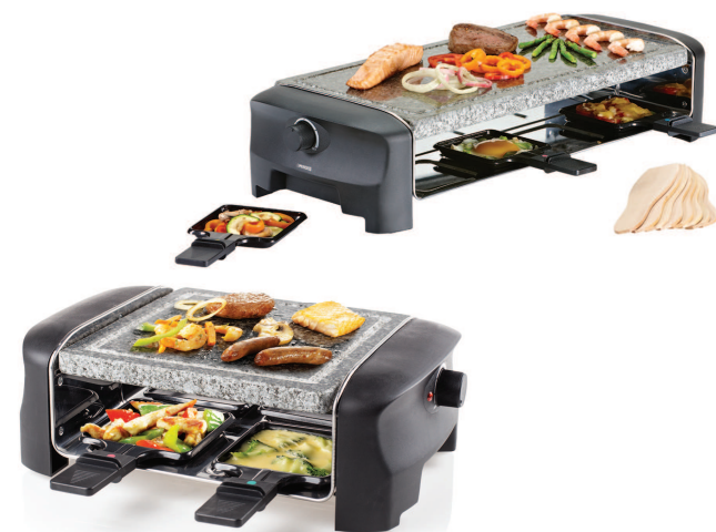
Raclette 4 Stone Grill Party | Raclette 8 Stone Grill Party 01.162810.01.001 | 01.162830.01.001

PARTS DESCRIPTION / ONDERDELENBESCHRIJVING / DESCRIPTION DES PIÈCES / TEILEBESCHREIBUNG / DESCRIPCIÓN DE LAS PIEZAS / DESCRIÇÃO DOS COMPONENTES / DESCRIZIONE DELLE PARTI / BESKRIVNING AV DELAR / OPIS CZĘŚCI / POPIS SOUČÁSTÍ / POPIS SUČASTI / ОПИСАНИЕ ЗАПЧАСТІ